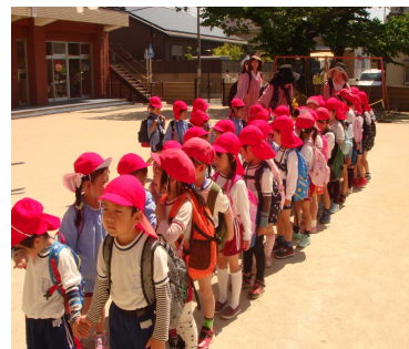
手つなぎが上手になりました