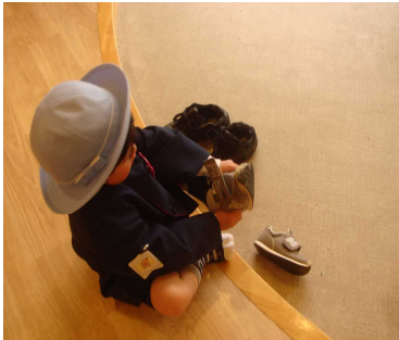
上手に靴を脱いでいます