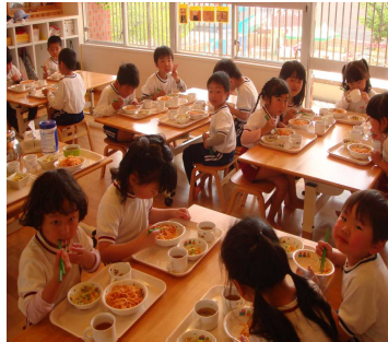
行儀よく給食を頂いています