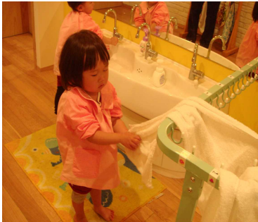
手を洗いタオルで拭けるようになりました トイレのスリッパを揃えています