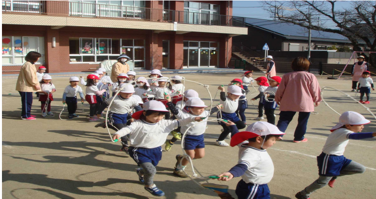
寒さに負けないで外遊びをする子どもたち

平成 29 年度の教育・保育活動も残すところ 2 ヶ月となりました。本年度は、増改築された園舎で 1 歳児・2 歳児の乳児保育部門と 3 歳児～5 歳児の幼児教育部門を併せ持つ「認定こども園」としてスタートしました。